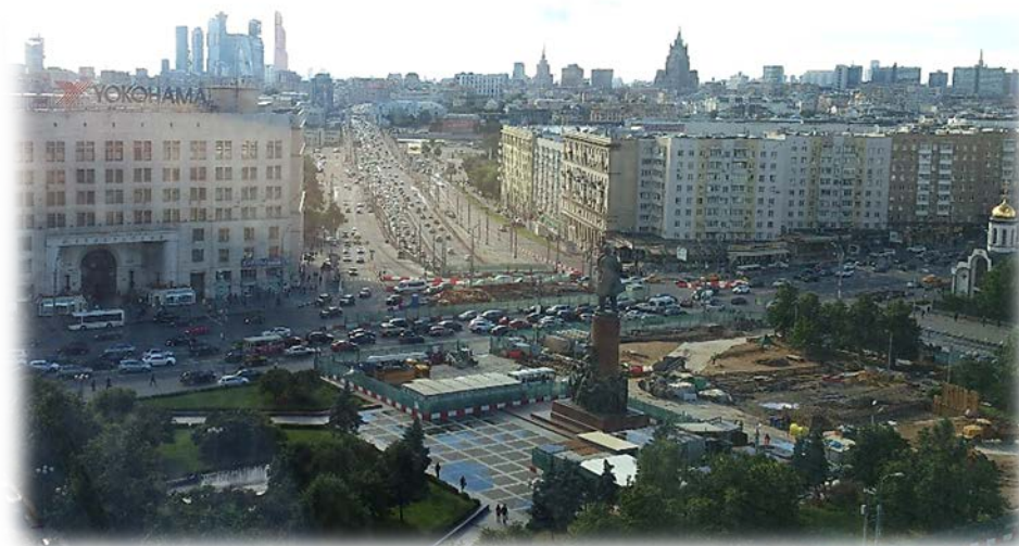
Панорамный вид из окна на центр города